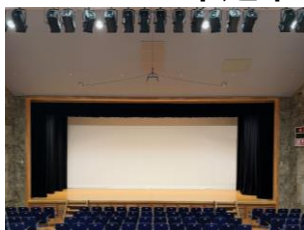
プロセニウム形式