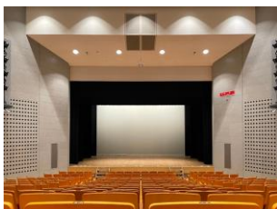
プロセニウム形式